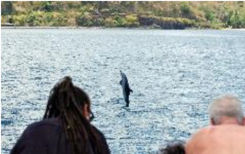
Le dauphin tacheté pantropical est l'une des espèces les plus sensibles au développement du whale-watching

Le sanctuaire Agoa , qui s'étend sur un espace maritime de 143 256 km 2 dans les Antilles françaises, est l'une des plus vastes aires marines protégées au monde. Créé en 2012, il a pour objectif de protéger les mammifères marins des impacts des activités humaines.